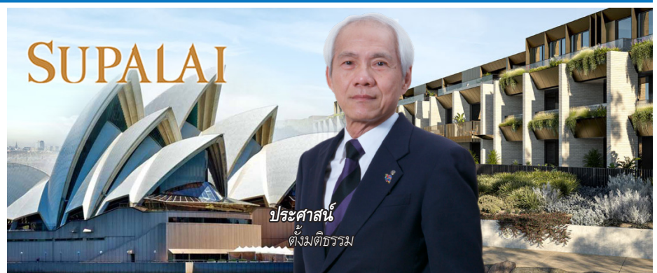
ประศาสน์ ตั้งมติธรรม

ขณะที่ยอดโอนกรรมสิทธิ์ในช่วงครึ่งปีแรกของปี 64 จากโครงการในออสเตรเลีย ทำได้ 1,726.4 ล้านบาท สูงขึ้นกว่าช่วงเดียวกันของปีก่อนที่ทำได้ 767.6 ล้านบาท โดยโครงการ