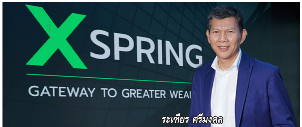
ระทีียร ศรีมิ่งคณ

ทั้งนี้ บริษัทยังมีแผนการเปิดตัวธุรกิจนายหน้าและผู้ค้าสินทรัพย์ดิจิทัล (Digital asset broker and dealer) รวมถึงแพลตฟอร์มซื้อขายสินทรัพย์ดิจิทัล และการขอใบอนุญาต Digital asset fund manager ที่อยู่ในระหว่างดำเนินการ และ Open-architecture licenses