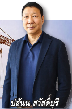
ปลั่งน สวัสดิ์บุรี

ชิงงานมูลค่า 2.6 หมื่นลพ. ดันรายได้ปี 66 โต 10%