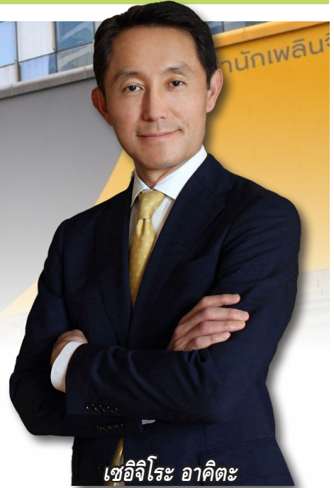
เชอิจิโร อาคิตะ

ธนาคารกรุงศรีอยุธยา หรือ BAY ตั้งเป้าสินเชื่อปี 66 เติบโต 3-5% โดยยังคงเดินหน้าปล่อยสินเชื่อแก่โครงการธุรกิจเพื่อสังคมและความยั่งยืน (ESG) เป็น 50,000 - 100,000 ล้านบาทภายในปี 73 ขณะที่ธนาคารตั้งเป้าหมายส่วนต่างอัตราดอกเบี้ย (NIM) อยู่ที่ระดับ 3.5% ในส่วนของรายได้ที่ไม่ใช่ดอกเบี้ย (NII) จะอยู่ในระดับเดียวกับปีก่อน รวมทั้งตั้งเป้าควบคุม NPL อยู่ในระดับ 2.5% - 2.6%